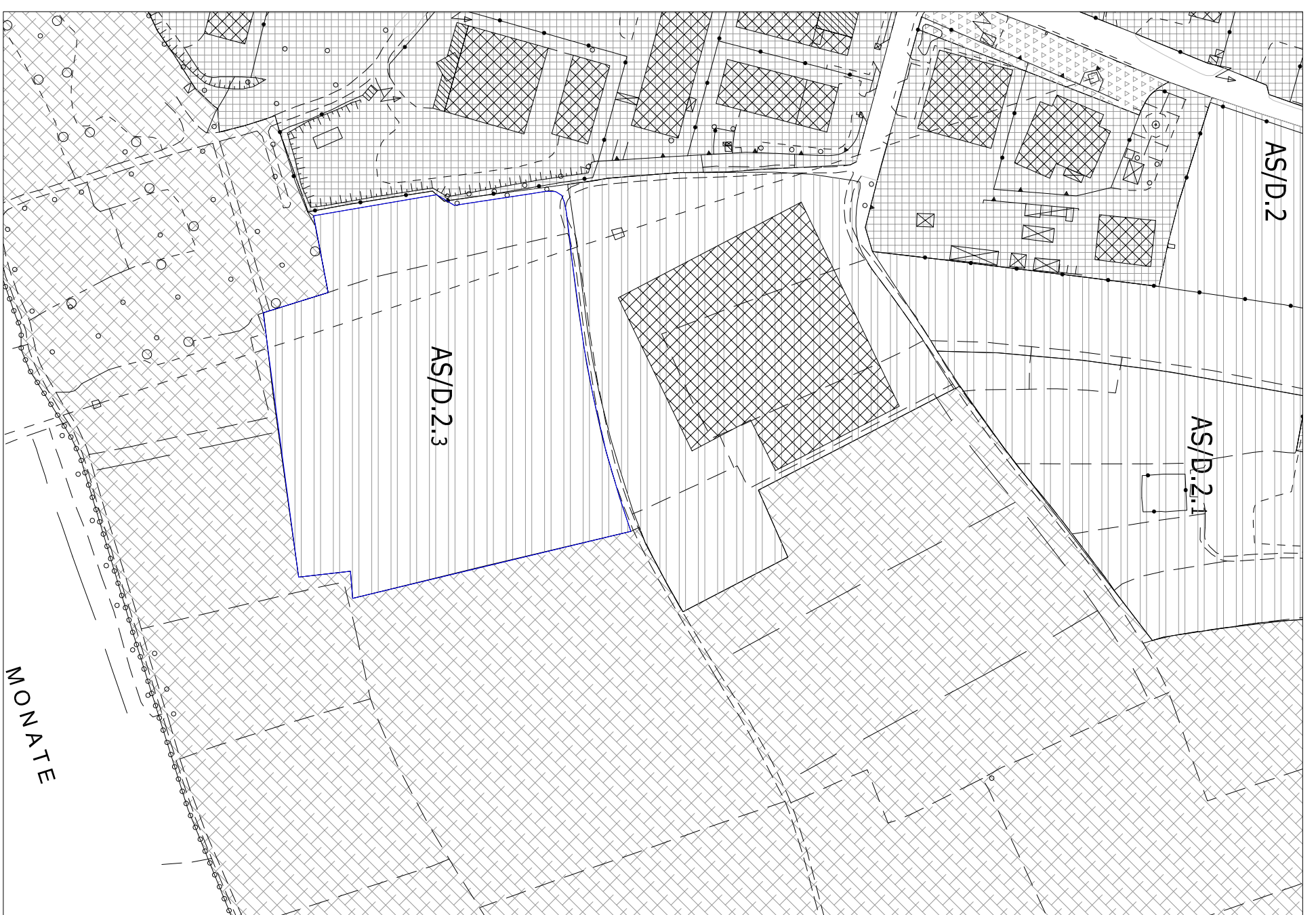
ESTRATTO PRG. Zona AS/D.2.3